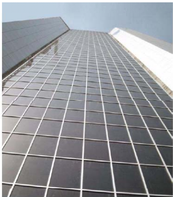
Tower ASI, SDN