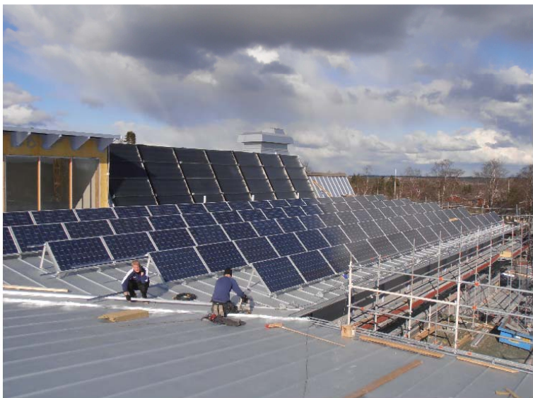
Ås Skola, Krokombro 500m 2