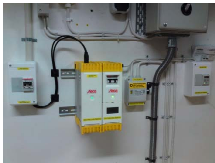
0,5 kW Växelriktare