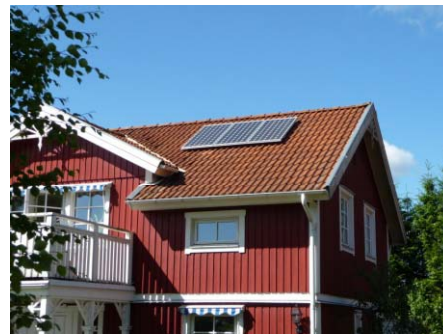
0,5 kW Ö:a Fågelvik