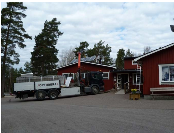
Montage på triangelstativ Kilenegården, Hammarö