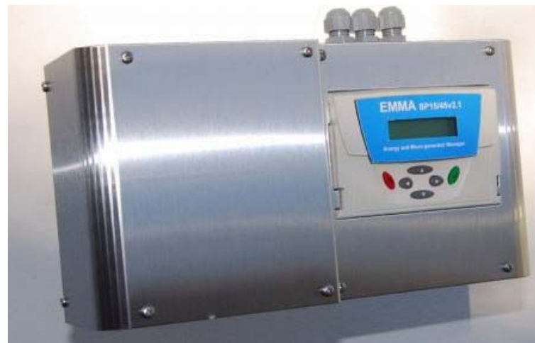
EMMA (Energy and Micro-Generator Manager)