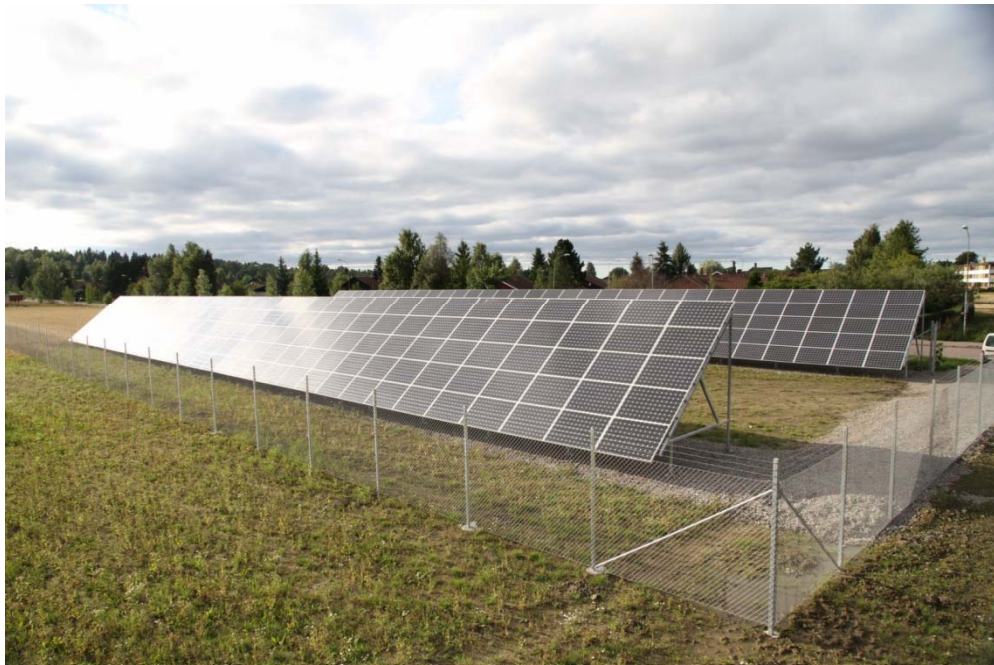
Solel i Sala och Heby 550m 2