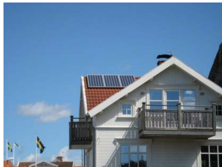
0,5 kW Bovallstrand

P = 1000W – Ca 8 m 2 solceller. Produktion 800-900 kWh/år ca 50 000 inkl. moms erhållet bidrag ca 20 000:-