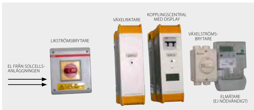
Anslutning av en solcellsanläggning